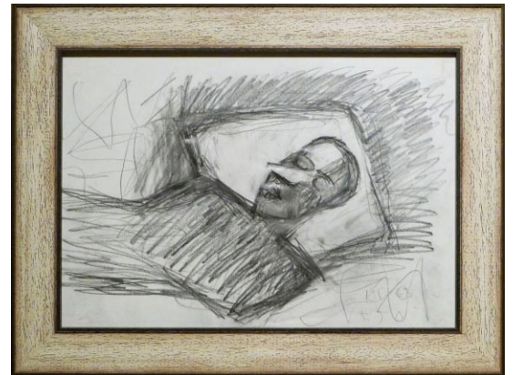
Tyyny, 2000, lyijykynäpiirros