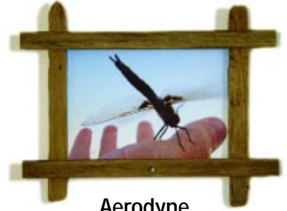
Aerodyne 2001-07-07 58 x 46 cm