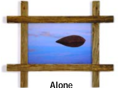
Alone 2001-04-10 71 x 58 cm