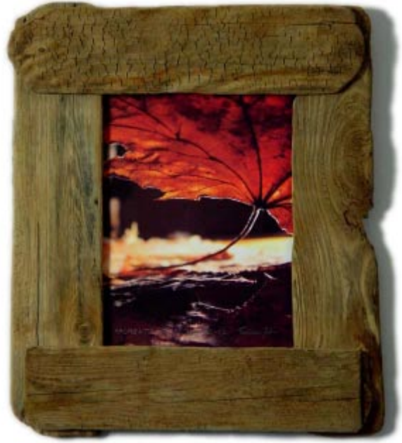
Moment 2000-12-12 36 x 43 cm

palaa samanlaisena. Ilman valotettuja ruutuja todisteenani epäilisin monesti, että mieleeni jääneet kuvat eivät todellisuudessa olleetkaan