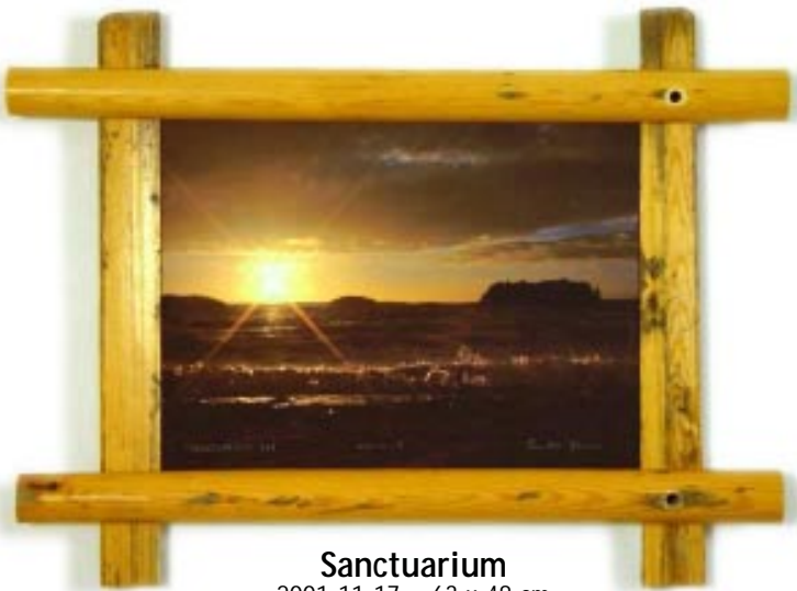
Sanctuarium 2001-11-17 63 x 48 cm

I would later almost believe that those visions in my brain did not really exist. Rather I would think that they were illusions of my mind. My