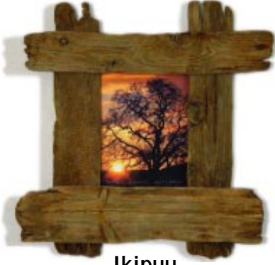
Ikipuu 2001-11-17 40 x 41 cm