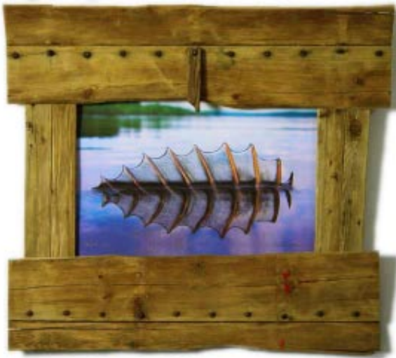
Aqua sail 2001-08-27 66 x 61 cm