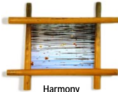
Harmony 2000-10-01 70 x 56 cm