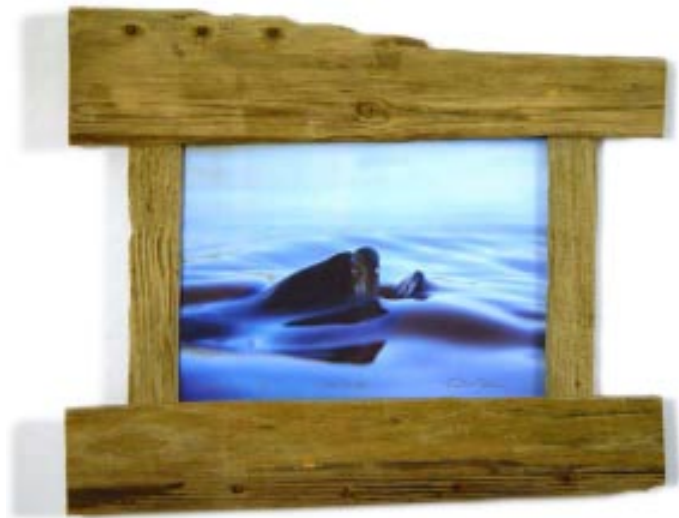
Breath 2001-07-05 53 x 45 cm

Myös kuvien kehykset ovat kuvauspaikoilta Pyhäjärven rantavedestä kerätyistä puunkappaleista tehtyjä. Rikkoutuneet soutuveneet, aironpalat