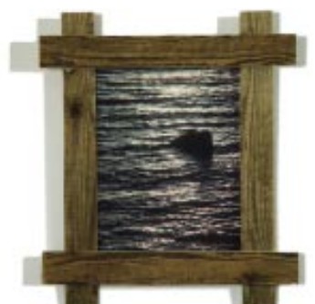
Pyhän järven kari 2 2001-11-17 35 x 41 cm