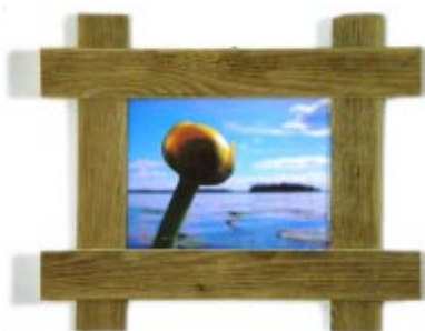
Pro insula 6 2001-07-22 35 x 30 cm