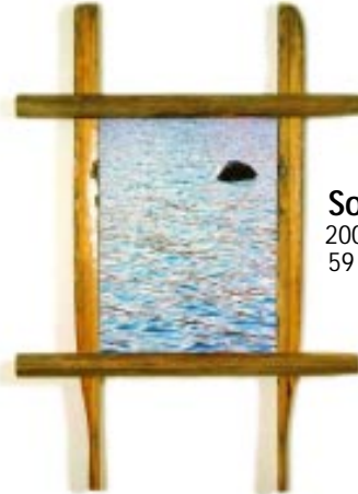
Solitaire 2001-09-26 59 x 85 cm

tärkeämpää kuin kohde, on koko ympäröivä avaruus sinä hetkenä jolloin aika seisahtuu tuokioksi. Tilanteen mentyä ohi näkymä ei koskaan