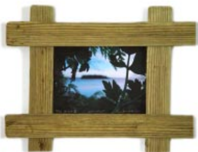
Pro insula 3 2001-05-09 38 x 30 cm