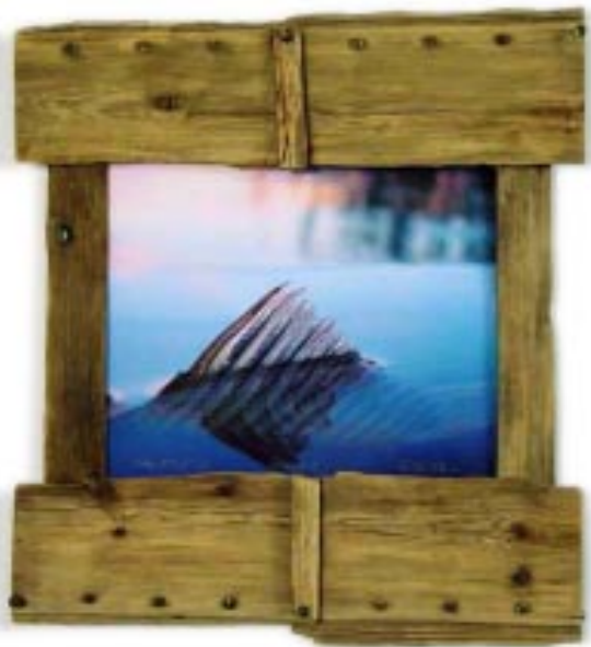
Aquatis 2001-08-13 51 x 54 cm