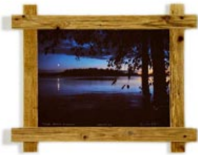
Pyhän järven hiljaisuus