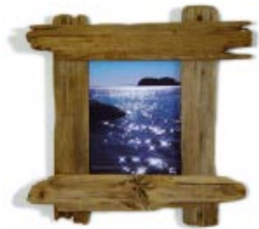
Kirjokannen kimallus 2001-06-06 43 x 43 cm