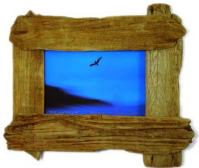
Yön Ilmatar 2001-06-10 31 x 29 cm