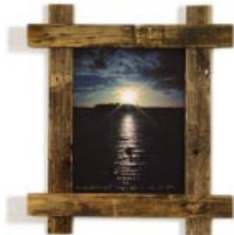
Pyhän järven kari 1 2001-11-17 37 x 43 cm