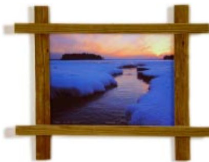
Veen selän polku