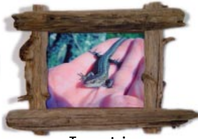
Terrestris 2001-07-29 51 x 36 cm