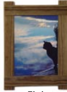
Tipi 2000-12-12 19 x 26 cm