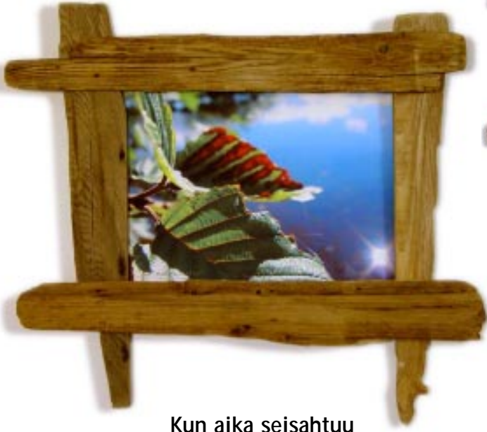
Kun aika seisahtuu 2000-09-15 70 x 61 cm