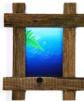
Tuokio 2000-06-12 28 x 34 cm