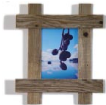
Still 4 2000-09-15 30 x 35 cm