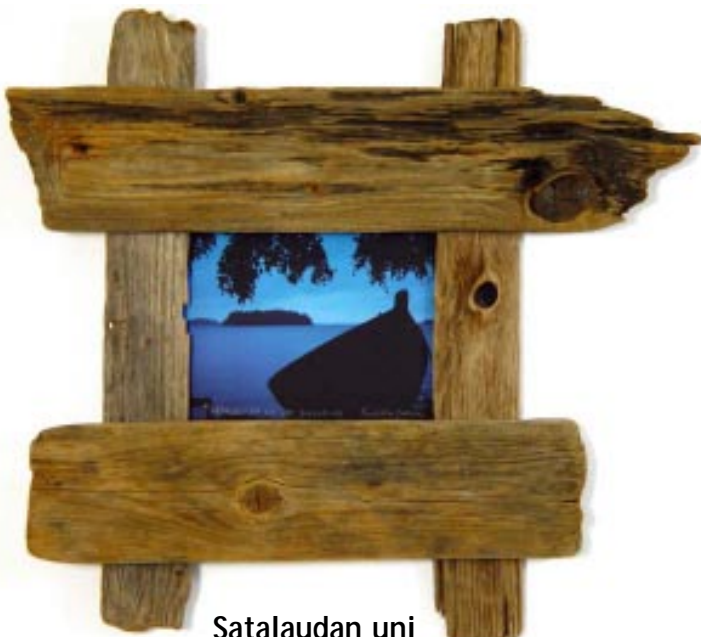
Satalaudan uni 2001-09-08 48 x 43 cm

exceptions. The picture frames are made from wood material collected from the Lake Pyhäjärvi at photo locations. Broken rowboats, pieces of oars,