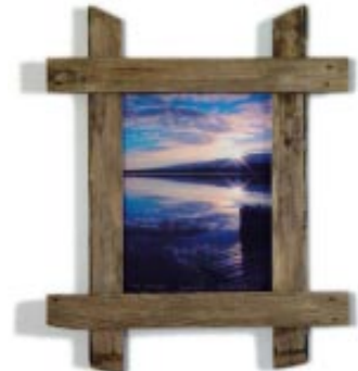
Tie veteen 2000-12-12 39 x 48 cm