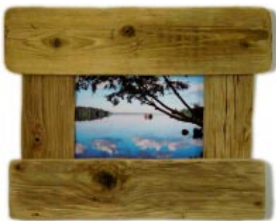
Aamu 2001-06-26 37 x 31 cm

important than an object is the whole surrounding space at that moment when time stands still. Without the proof of the exposed frames,