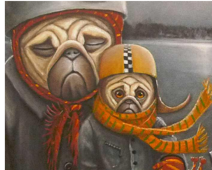
Ilta-ajelu (ja sen yksityiskohta)