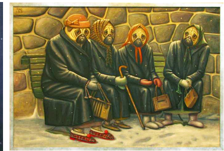
Kylä toi Manta on sitte muorikas