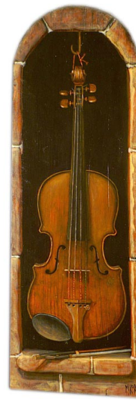
Lepäävä viulu III